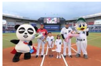
イメージ(花束贈呈)