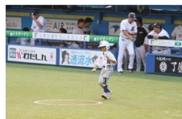
イメージ(ボールボーイ体験)